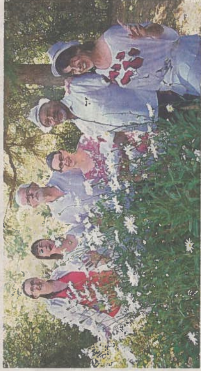
Jazz à Set partagera l'affiche avec le chœur mixte des Voix du Marensin. JAZZ A SET

Dimanche 23 avril, à 17 heures, en l'église Notre-Dame de Lit. Entrée libre.